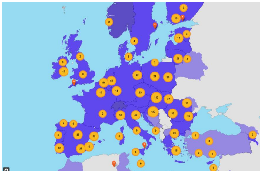
Obrázek 1: Interaktivní mapa událostí dostupná na stránkách Evropské komise